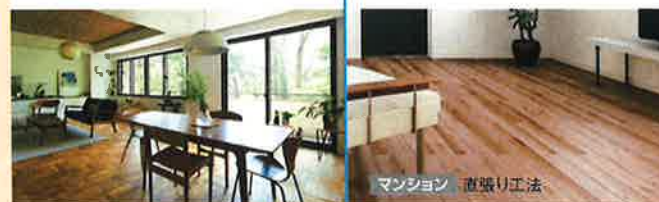
マンション 直張り工法